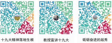
十九大精神落地生根 教授宣讲十九大 砥砺奋进的越秀